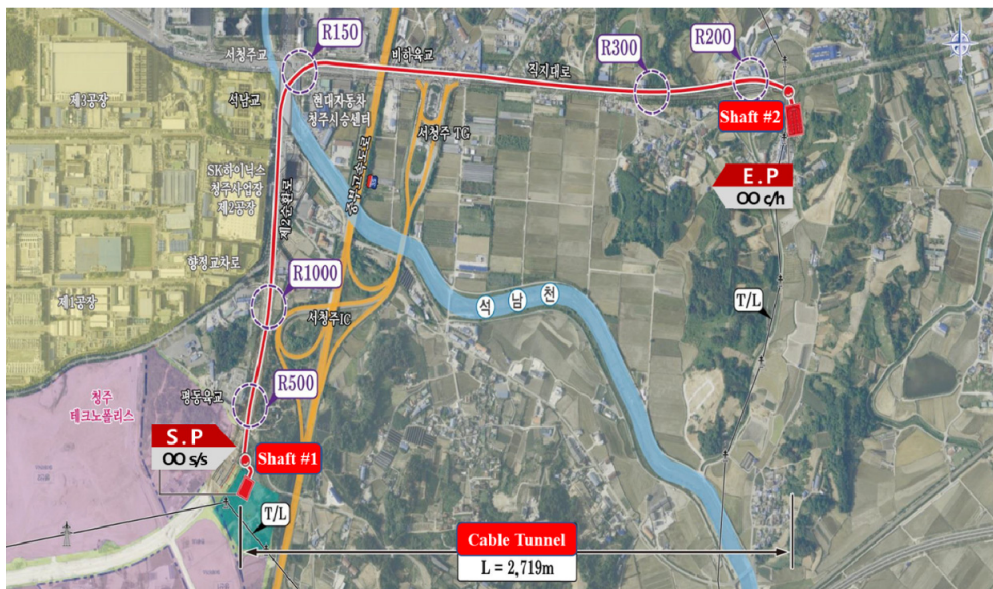
Fig. 1. Plane condition of slurry shield TBM tunnel

본 터널공사는 총 연장 2,719 m 중 이수식 쉴드TBM 터널연장은 2,556 m이다. 발진부의 수직구는심도 66 m, 내경 9.0 m에서 장비를 조립하고, 발진부 전방에 3 m의 NATM을 계획하였으나, 장비조립과 시공성을 고려하여 5 m로 변경하였다. 이수식 쉴드TBM은 종단구배 +0.34%로 상향굴진하며 석남천 하부를 통과한 후 곡선반경 R = 150 m구간의 선형관리를 하면서 도달부 인근에서는 R = 300 m 및 R = 200 m 구간이다(Fig. 3).